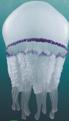
■ RHIZOSTOMA 20-60 cm