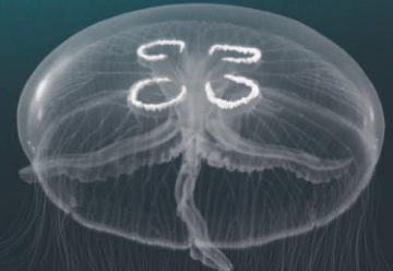
■ AURELIA 10-40 cm