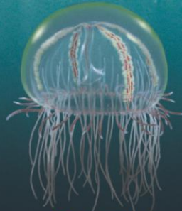
■ OLINDIAS 4-6 cm