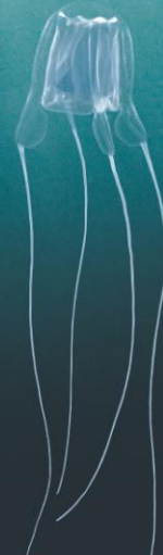
■ CARYBDEA 4-5 cm