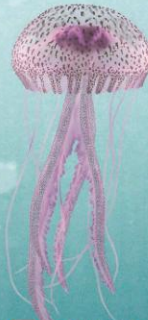
■ PELAGIA 5-10 cm