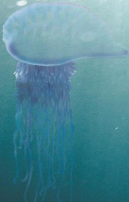
■ PHYSALIA 10-15 cm