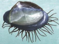
■ VELELLA 5-7 cm