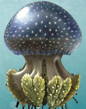
■ PHYLLORHIZA 30-60 cm